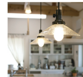
照明のプランニングも当社の得意分野。オーナーの要望を伺いながら、女性プランナーが、様々な提案を行います。