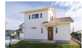
青空と緑の空生が似合う白亜の外観。オレンジ色の高級木の扉横長が、同様な印象を与えます。