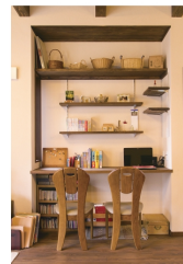
キッチンの隅に設けられたカウンターと造作棚。パソコンやちょっとした集客のスペースとして、毎日活躍しています。