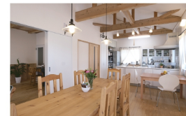
高い天井にかかる梁が目を惹くLDK。大きなダイニングテーブルも、脚取りにあわせて造作された一点ものです。