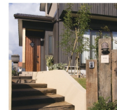
外観をより一層引き立てる外壁。柱木の職材を利用した造りのあるアプローチが、実客をおたたくくみ入れます。