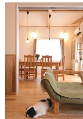
床は杉の穿違り仕上げ。色は温かく、夏はさらりとした蒸れり、一年中心地いいのは、人ばかりではないようです。