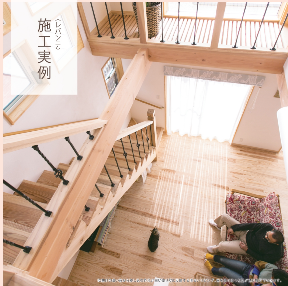
以前は木の床のみの部屋でしたが、白い壁と天井をプラスして、空間をより広く感じることができました。