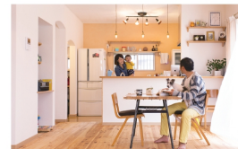
リビングの壁面は「ヘルシーカラー」で塗られています。高い断熱効果や有害物質の発着抑制で、小さなお子様にも安心の環境です。